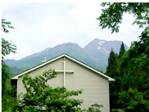
旧・日本基督教団 妙高高原教会

池の平温泉・妙高高原ビジターセンター・妙高ベースキャンプの西に位置する「池の平クリスチャン村（ICA）」には、1964年に建設された「妙高高原教会」がありました。しかしこの教会堂は2022年2月の豪雪によって建物が全壊してしまい、教会堂があった場所には現在なにも残されていません。2023年11月現在、ICAは「妙高高原教会・会堂の再建」に向けて再建プランの公募を開始し、2025年7月中の竣工を目指して再建計画を進めています。